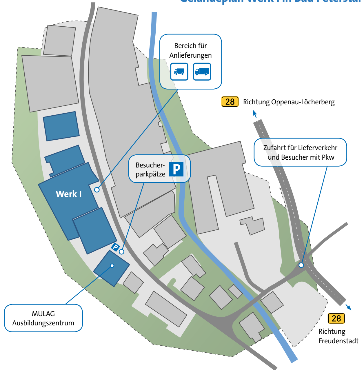
Schematische Darstellung des Werksgebietes Werk I in Bad Peterstal-Griesbach.