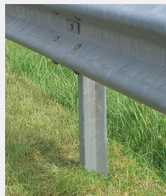
Ausmähen von Schutzplanken

Die regelmäßige Pflege des Straßenbegleitgrüns ist ein wichtiger Faktor für die Sicherheit aller Verkehrsteilnehmer. Der Leitpfostenausmäher MLM 200 reduziert das Gefahrenpotenzial für Straßenwärter erheblich, da die Notwendigkeit für manuelle Nacharbeiten in den Problemzonen entfällt. Sicher und effizient von der Fahrerkabine aus kann das schnell hochwachsende Restgrün an Schutzeinrichtungen ausgemäht werden – ein echtes Sicherheitsplus!