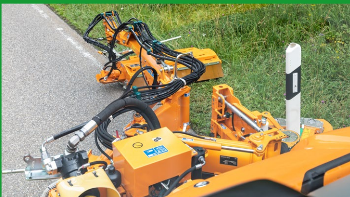
Blick auf die Mähgeräte