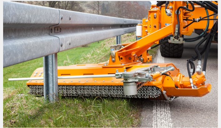
Randstreifenmähkopf RMK 1200

Das Randstreifen-Mähgerät MRM 300 wird an die Frontanbauplatte des Unimog angebaut und ist ideal für den Ein-Mann-Betrieb geeignet . Es kann für den Rechts- oder Linksbetrieb eingesetzt werden. Der Antrieb erfolgt über die fahrzeugseitige Leistungshydraulik oder über die Frontzapfwelle des Trägerfahrzeuges. Der MRM 300 kann wahlweise mit zwei bewährten Messerwellen-Konzepten bestückt werden.