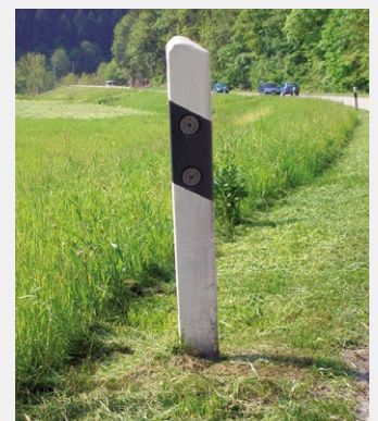
Ausmähen von Leitpfosten