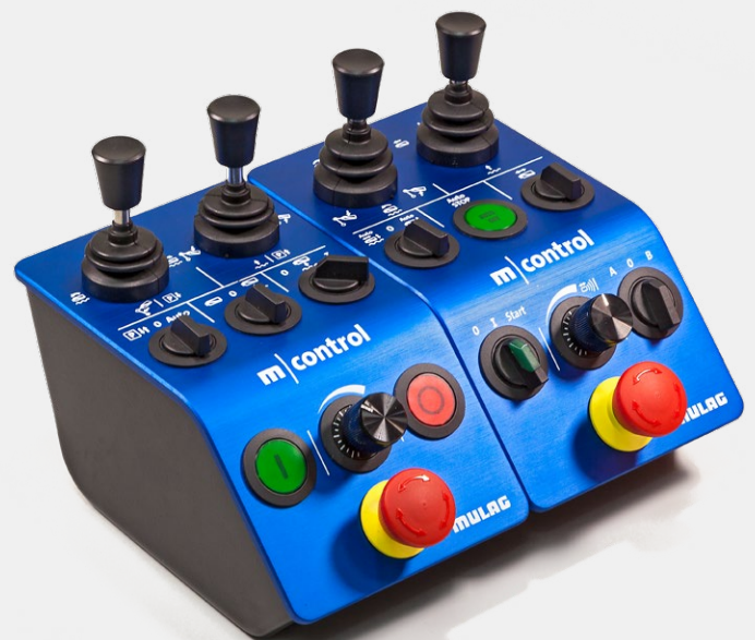
Gerätesteuerung für MRM 300 mit zusätzlichem Bedienteil für MLM 200

Eine Nachrüstung ist auch an bereits vorhandenen Randstreifen-Mähgeräten möglich.