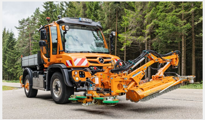
MRM 300 / MLM 200 in Transportstellung