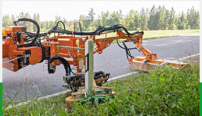
MLM 200 – Ideale Ergänzung zum Einsatz eines Randstreifenmähers