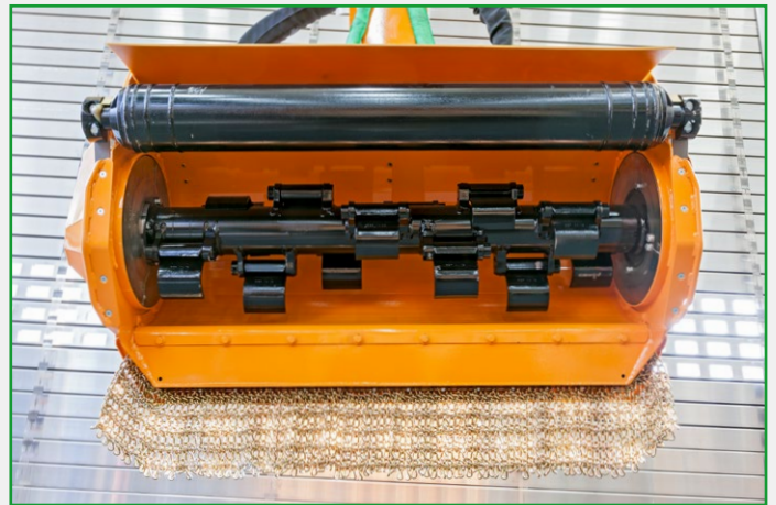
Hochwertige Verschleißteile sind wichtig für einen reibungslosen Betrieb.