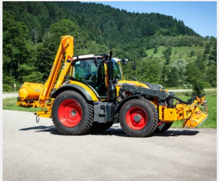
Transportstellung Heckausleger GHA 600 P und Randstreifenmäher MRK 300G

Weitere Arbeitsgeräte aus unserem umfangreichen Sortiment auf Anfrage