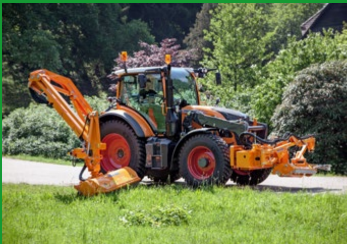
Solobetrieb des Heckausleger-Mähgerätes GHA 600 P