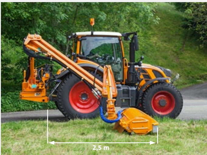
Parallelogrammausleger mit großem Vorschwenkbereich bis zu 2,5m

Das Böschungsmähgerät GHA 600 P wird in die heckseitige 3-Punkt-Aufnahme des Traktors angebaut und ist somit ideal für einen kombinierten Mäheinsatz mit einem Randstreifenmähgerät geeignet. Der Arbeitsbereich umfasst eine Reichweite von bis zu 6,0 m ab Fahrzeugmitte. Der Antrieb erfolgt über die Heckzapfwelle mit einer leistungsfähigen Axialkolbenhydraulik.