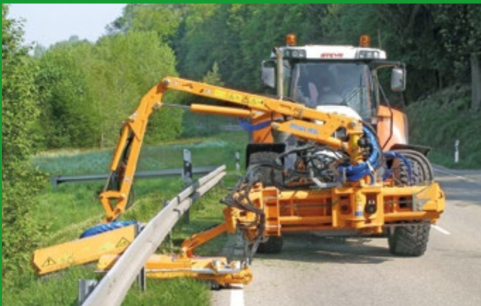
Vielseitig einsetzbar – auch im Bereich von Schutzplanken