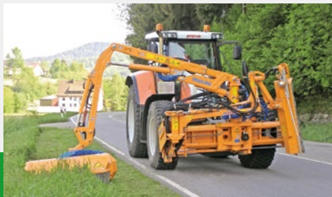
Beide Ausleger sind auch im Solobetrieb einsetzbar