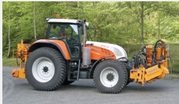
MKF 600 in frontseitiger Transportstellung