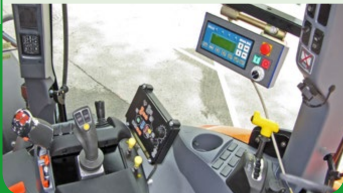
Einhebelbedienteil zur Steuerung beider Ausleger

** Werte nach Demontage des Randstreifenmähers