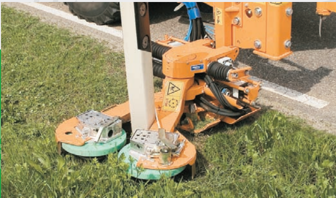
Profigerätetechnik in bewährter MULAG-Qualität