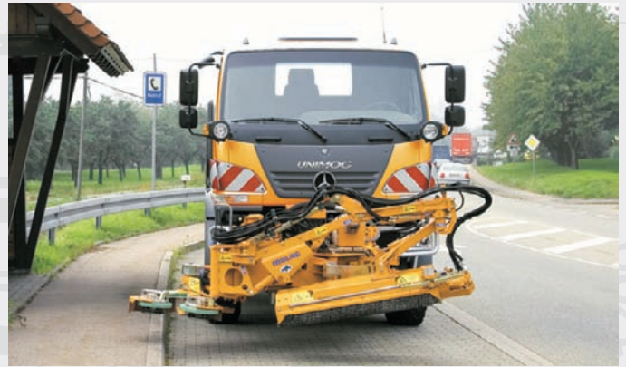
MLM 200 an Unimog U20 in Transportstellung