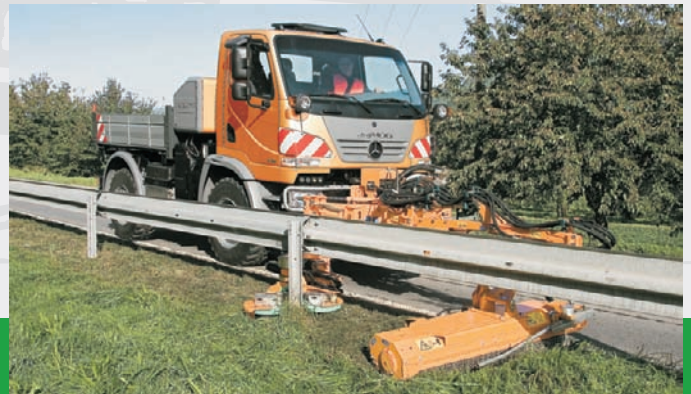
Ideale Ergänzung zum Einsatz eines Randstreifenmähers