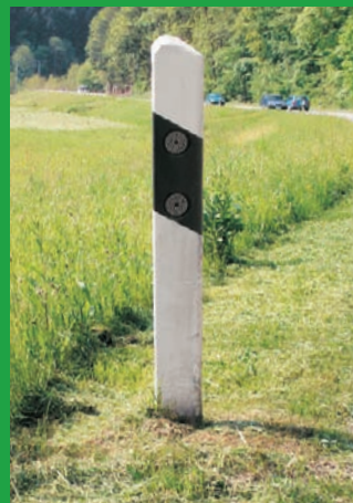
Ausmähen von Leitpfosten