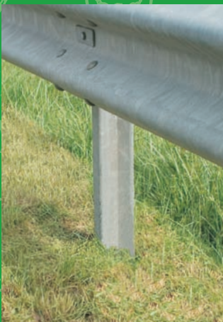
Ausmähen von Schutzplanken