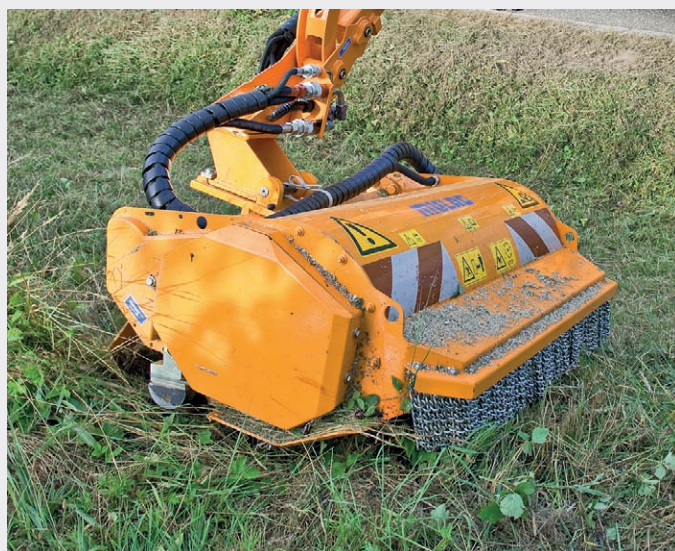
Eine optimale Lösung für den professionellen Mäheinsatz