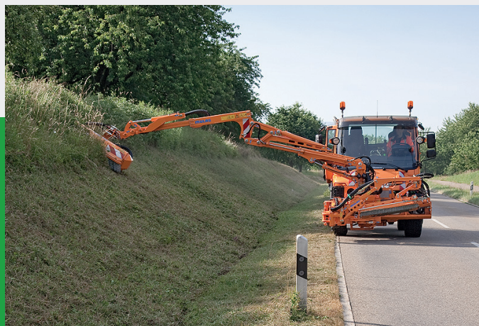
Der MK 1200 plus im Einsatz am MKV 800