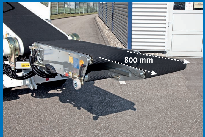
Teleskopfunktion zum Ausfahren des Transferförderbandes