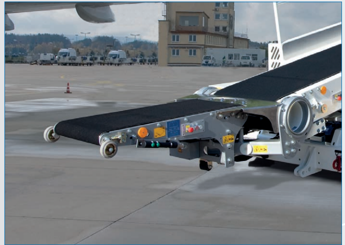
Multitransfer Grundgerät im Anbau an den Bandkörper

Abweichungen je nach Ausstattung möglich (ca. Angabe ±5%)